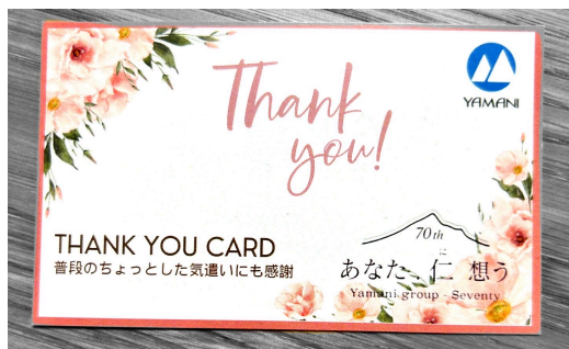
理念&ロゴ入りサンキューカード。かわいい♡

2月の周年記念式典を終え、6月の終わり。改めて山仁グループの社長様とお会いする機会がありました。そこで見せていただいたのは、企業理念と70周年ロゴをあしらった名刺サイズの「サンキューカード」。