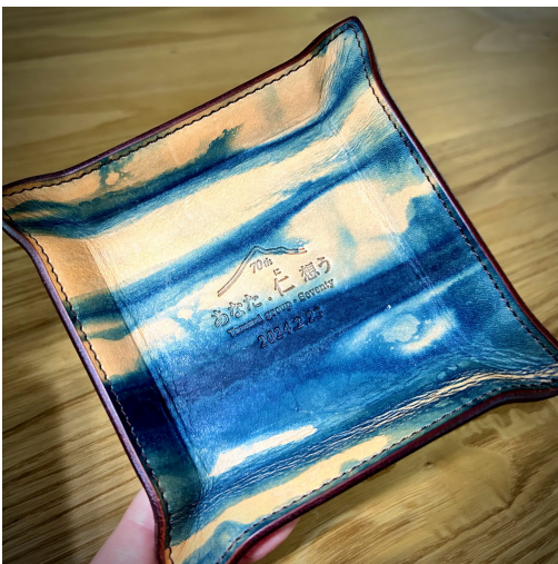
理念＆ロゴが刻印された引き出物のオリジナルトレー。 ジャパンプルーが美しい藍染めされた革。

グループ会社の山仁薬品株式会社様、山仁産業株式会社様は、理念経営を徹底されています。「経営方針書」を手帳にしています。それも、細かなところを見直しながら、毎年、作り変えているほど。もちろん、社員さんにただ配布するだけでなく、毎日の朝礼で唱和したり、輪読したりなど、社内の誰もが肌身離さずにお仕事している徹底ぶりです。社長様の経営方針書には、気づかれたことなどの書き込みがたくさんありました。