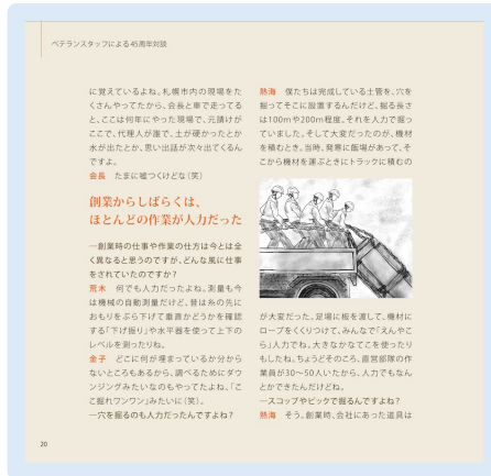
当時の写真がないので、イラストで表現 手作業感わかりますか？

ちなみに現在の栄建設様は、素晴らしい福利厚生の仕組みをお持ちで、社会貢献活動にも力を入れられており、さらに積極的に外国人も採用、定期的にご家族も日本へお招きするなど、素晴らしい企業です。ほぼ離職もなく、社員が友人を連れてくるなど採用に困っていることもございません。そんな優良企業ですが、創業時の労働環境/条件はとても過酷な環境でした。私達制作チームはそのお話を「大笑い」しながら、聞かせていただきました！笑いながらとは、失礼なお話ですが、それくらい現在では考えられないご苦勞を乗り越えていらっしゃったのです。そのご苦勞の積み重ねが今に繋がっています。