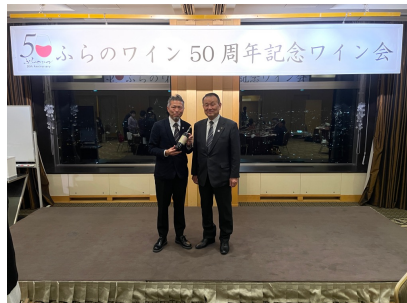
北海道 富良野市長と記念のツーショット

北海道のへそ（中心）に位置する富良野市は、彼の有名なテレビドラマ「北の国から」のロケ地としてその知名度は全国区です。そんな富良野市に今から50年以上も前にワインの醸造所が開設されていたとは...驚きです。